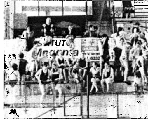
Il pubblico scatenato dei Giochi

atletica in pista con quasi 4.000 ragazzi». I vincitori della fase provinciale di ieri mattina andranno ora a misurarsi con i coetanei di tutta la Lombardia, il 6 aprile alle regionali di Cremona. Gli